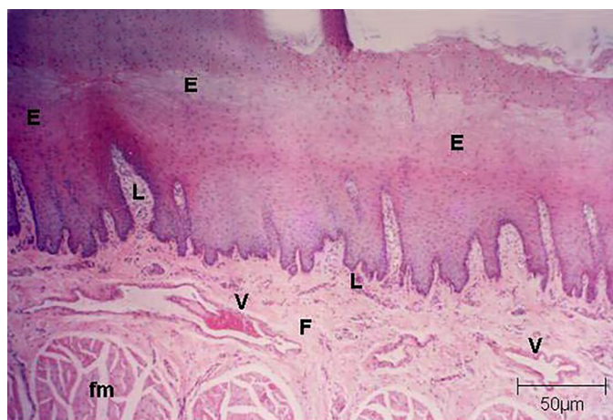
Fig.3. Língua de um cervo do pantanal ( Blastocerus dichotomus ) adulto indicando o epitélio (E) e abaixo deste, formando a lâmina própria, fibras colágenas (F), acúmulo de tecido linfático (L), feixes musculares (fm) e vasos (V). HE, obj.10x.