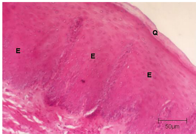
Fig. 2. Língua de um cervo do pantanal ( Blastocerus dichotomus ) adulto indicando o epitélio estratificado pavimentoso (E) queratinizado (Q). HE, obj.10x.

Na mucosa da língua do cervo do pantanal foram observadas elevações coriepiteliais formando as seguintes papilas linguais: filiformes, lenticulares, fungiformes e circunvaladas. Histologicamente a papila filiforme do cervo do pantanal apresentava-se em forma de cone, revestido por queratina. As papilas fungiformes do cervo do pantanal estavam revestidas por epitélio estratificado pavimentoso